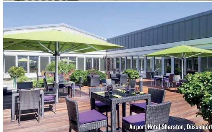
Airport Hotel Sheraton, Düsseldorf