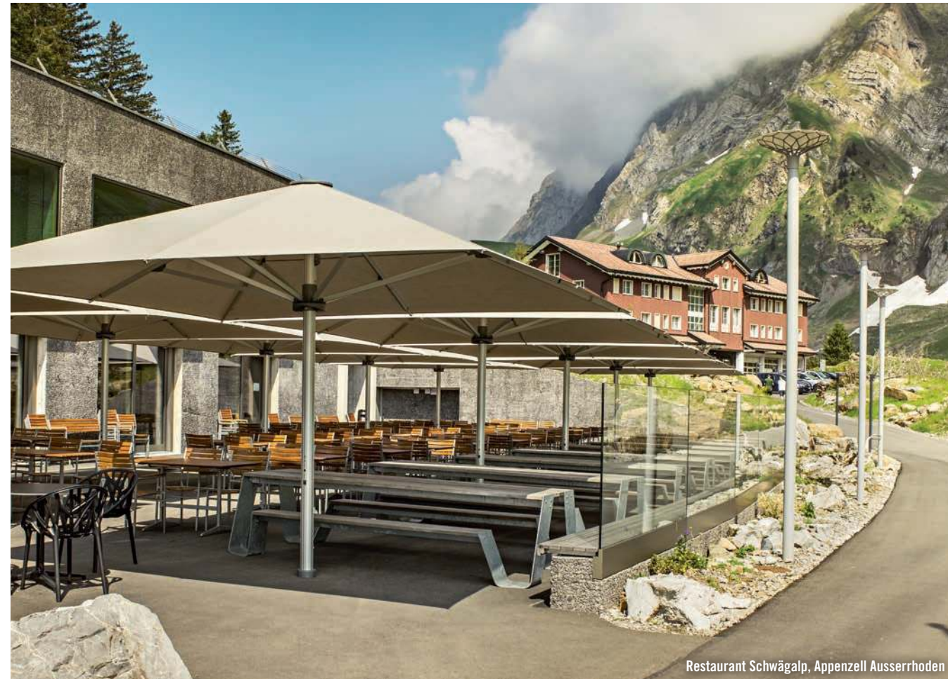
Restaurant Schwägälp, Appenzell Ausserrhoden